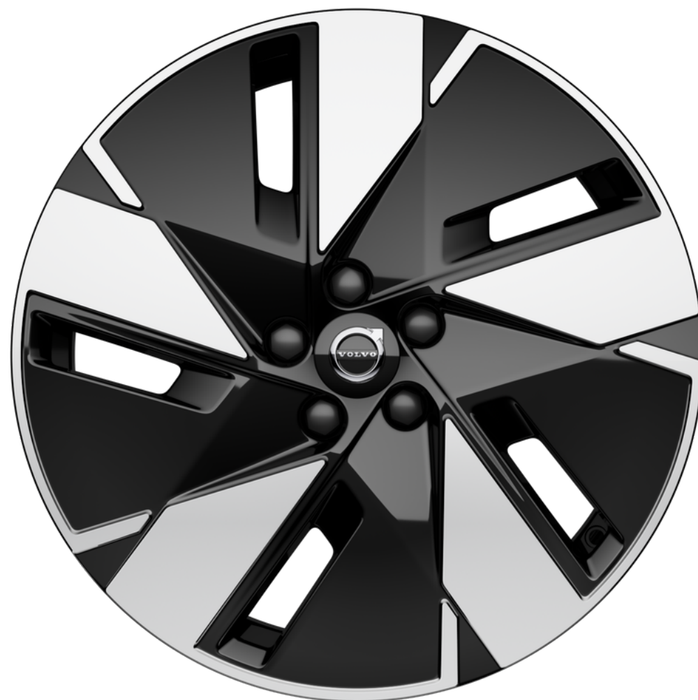
Rodas de liga leve 19"