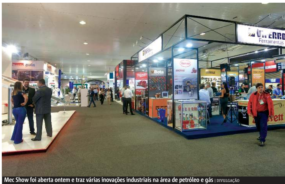
Mec Show foi aberta ontem e traz várias inovações industriais na área de petróleo e gás

Espírito Santo Mec Show e Expo Construções (Carapina Centro de Eventos, na Serra, das 15h às 21h). Até amanhã. Entrada franca.